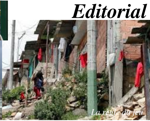
La règle du jeu