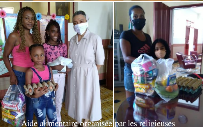
Aide alimentaire organisée par les religieuses