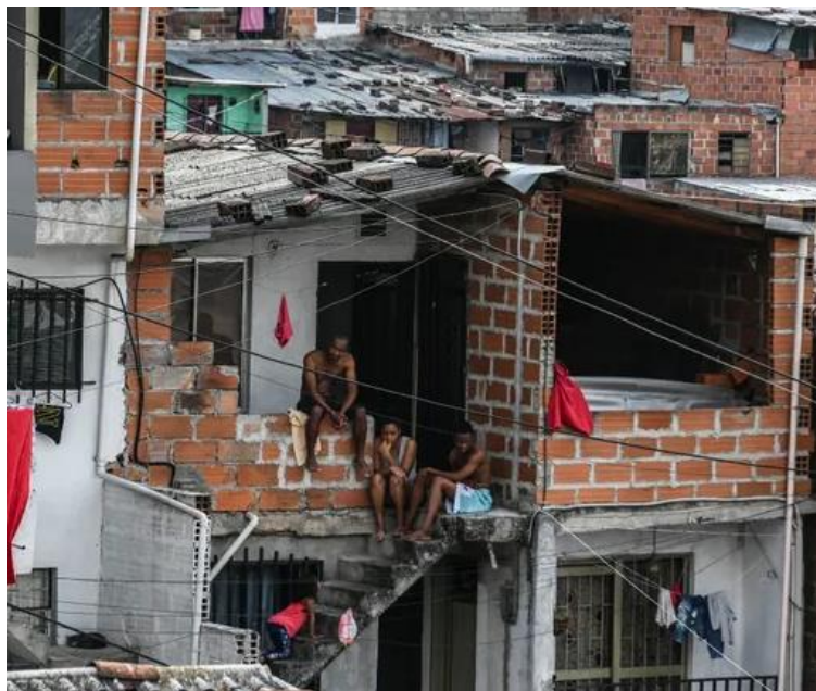
les chiffons rouges de la détresse « aidez-nous, ici on n'a plus de quoi manger »