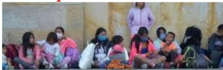
Aide alimentaire par les religieuses