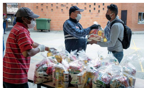
Des associations et communautés religieuses mettent en place de l'aide alimentaire

En Colombie les réfugiés vénézuéliens craignent plus la faim que la Covid19. Confronté à une contestation d'une ampleur inédite, le président Yvan Duque a entamé avec les élus une grande concertation nationale qu'il promet d'élargir aux différents secteurs sociaux pour tenter de calmer la pandémie de la faim.