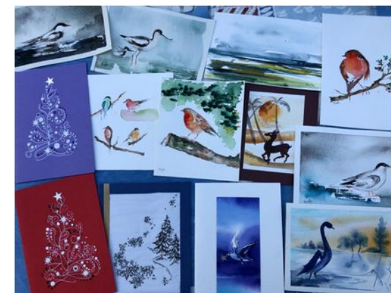
Ac 01 et Ac 02

D'autres cartes aussi disponibles sur place lors de votre collecte